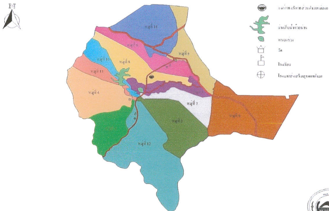
แผนที่ ตำบลแม่ลอย อำเภอเทิง จังหวัดเชียงราย

โดยใช้เส้นทางการคมนาคมไปตามทางหลวงแผ่นดินหมายเลข ๑๐๒ (สายเทิง – เชียงราย) ทางหลวงแผ่นดินหมายเลข ๑๒๙๒ (สายปากทางแม่ลอยไร่-อำเภอจุน จังหวัดพะเยา) และถนนทางหลวงชนบทหมายเลข ๔๐๐๕ (สายแม่ลอยไร่-บ้านแม่พุง ตำบลป่าแดด อำเภอป่าแดด จังหวัดเชียงราย) เป็นเส้นทางหลักในการติดต่อระหว่างตำบล และอำเภอเทิง ตลอดจน อำเภอเมือง จังหวัดเชียงราย